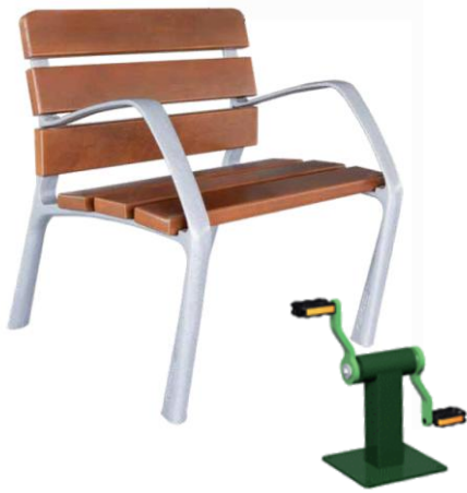
Exemple d'usage avec le pédalier : EN80913 (en option)