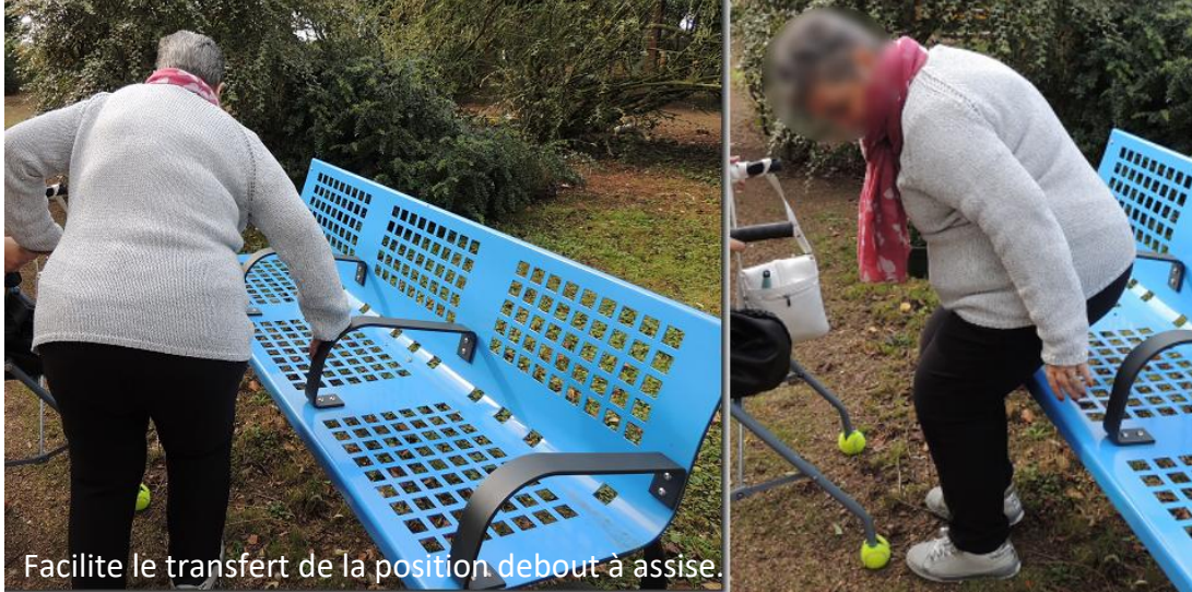
Facilite le transfert de la position debout à assise.

Banc ELITE spécial EHPAD, avec quatre accoudoirs Réf : EL4A.