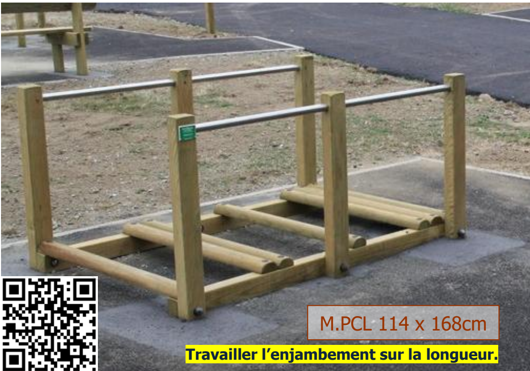
M.PCL 114 x 168cm

Travail sur l'allongement du pas. Enjambement d'un obstacle