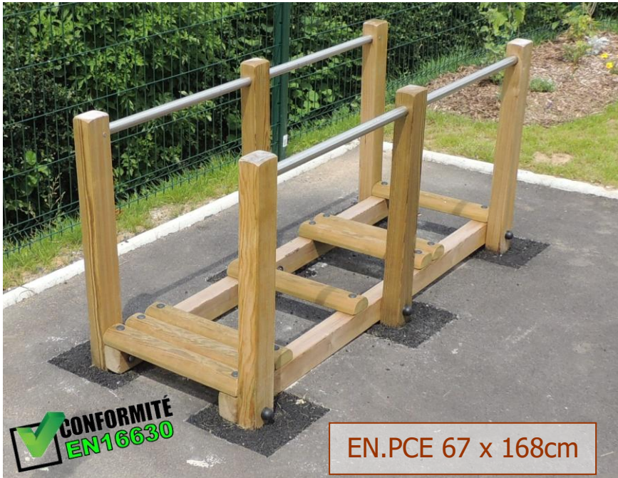
EN.PCE 67 x 168cm

EN.PCL Large et EN.PCE version étroite. Adapter le pas en fonction de l'obstacle.